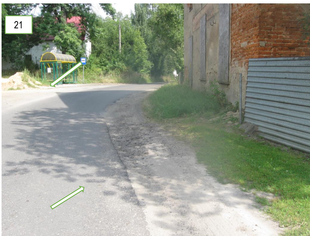
Foto 16, 17, 18, 19, 20, 21 – Ubytki nawierzchni na krawężniach i jezdni, spękania siatkowe i wzdłużne przy krawężniach jezdni oraz na powierzchni jezdni.