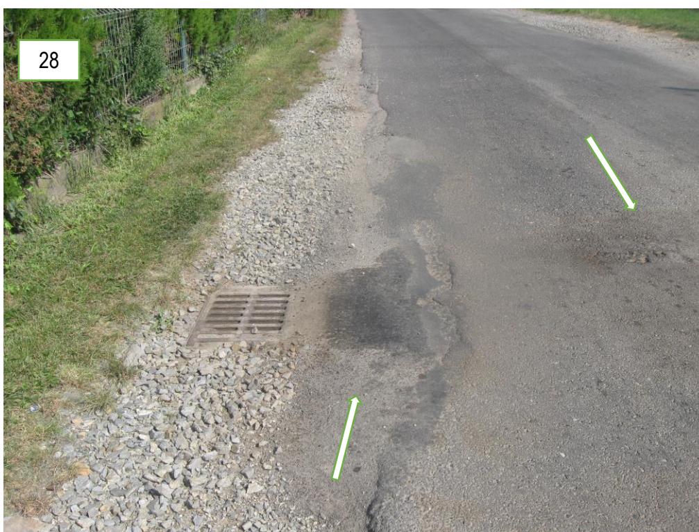
Foto 22, 23, 24, 25, 26, 27, 28 – Ubytki, spękania siatkowe i wzdłużne przy krawędziach jezdni oraz na powierzchni jezdni.