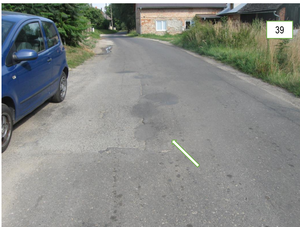
Foto 29, 30, 31, 32, 33, 34, 35, 36, 37, 38, 39 – Ubytki, spękania siatkowe i wzdłużne przy krawędziach jezdni oraz na powierzchni jezdni, uszkodzone studnie kanałów odwadniających, uszkodzone – wypłukane pobocze z podmytym ogrodzeniem.

Km drogi 8+400 – 9+330 – odcinek Rudziczka