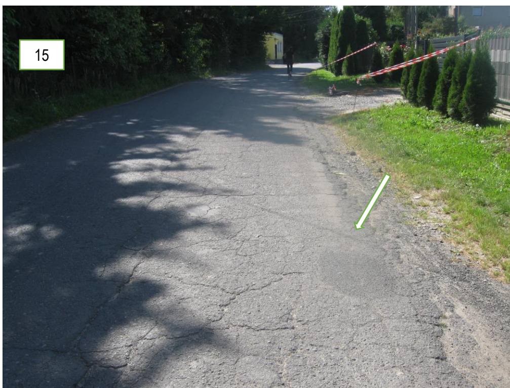
Foto 1, 2, 3, 4, 5, 6, 7, 8, 9, 10, 11, 12, 13, 14, 15 – Ubytki nawierzchni na krawędziach i jezdni, spękania siatkowe i wzdłużne przy krawędziach jezdni oraz na powierzchni jezdni, uszkodzone bariery ochronne, uszkodzone studnie kanałów deszczowych.